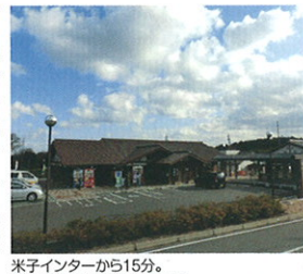
米子インターから15分。山陰道名和ICを降りてすぐ。

大山の食の恵みと観光情報をまとめてゲットできる道の駅です。店内に並ぶ新鮮野菜、加工品、おみやげ品には生産者の名前が刻まれ、作り手の愛情と情熱を感じられます。併設のレストラン&カフェでは、大人気の「紅茶ソフトクリーム」や「大山チキンチリバーガー」など、ご当地グルメが気軽に味わえます!