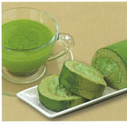
大山抹茶ロール&抹茶ラテ

1801年創業のお茶屋です。大人気のお抹茶ケーキ「大山抹茶ロール」やお家で簡単カフェの味「大山抹茶ラテ」をはじめ、老舗だからこそご提案できるお茶のある暮らしをご堪能ください。詳しくはホームページか、「岩倉町本店」「米子高島屋店」「米子天満屋店」「鳥取大丸店」渋谷広尾の「椿宮善」本社配送センターまでご連絡ください。