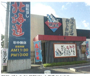
新鮮、テカネタ! 回転すしと備るなかれ!!

ネタは境港などの地元漁港から毎日直送。目の前でさばく鮮度抜群のネタが自慢。地元日南町産の米を使用したシャリやかけ醤油はお店オリジナルブレンドというこだわりの地元回転すし店。毎日変わるおすすめボードの地魚は要チェックです!!