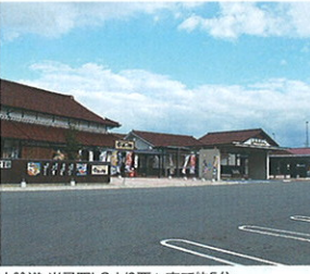
山陰道 米子西ICより西へ車で約5分

鳥根の東の玄関口にある道の駅。神話のふるさと山陰の旅はここから始まる「直売所」なかうみ菜彩館」では旬の地元産野菜や果物が豊富に並ぶ。古民家レストラン「中海の郷」では「出雲そば」「安来産どじょう」が楽しめる。「駅中屋台」の一番人気「安来フルーツ牛乳ソフト」は必食です。