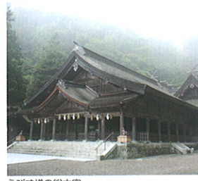
えびす様の総本宮

えびす社の総本宮で、本殿は国の重要文化財に指定。御祭神は五穀豊穡、子孫繁栄、歌舞音曲の「三種津姫命」と、鯛を手にする神えびす様として知られる。海上安全、大漁満足、商売繁盛、歌舞音曲の「事代主神」。毎月7日は「七日えびす」が行われ、この日にだけ受けることのできる特別なお守りがあります。