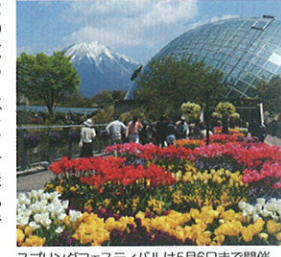
スプリングフェスティバルは5月6日まで開催

秀峰大山を望む、日本最大級のフラワーパーク。約10万株の花のじゅうたんが広がる「花の丘」や園内各所の花壇のほか、巨大なガラス温室「フラワードーム」などで1年中四季折々の花々を楽しめます。また園内を一周する1kmの展望回廊は屋根付きなので、雨の日でもゆったりと過ごすことができます。