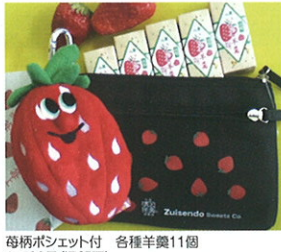
每柄ポシェット付 各種羊羹11個 1,500円(通販可)

山陰銘菓、伝統200年の清水羊羹老舗、瑞泉堂の「いちご羊羹」をお土産にどうぞ。他にも抹茶、かぼちゃ、焼き芋、栗等の羊羹も有ります。1個115円(税込)、6個入り650円(税込)。清水寺三重塔前売店、鳥根県物産観光館、道の駅あらエッサ、水木しげるロード内千代むすび酒造などでお求め頂けます。